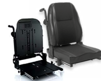
Rücken: ATA 2172 bzw. 2173