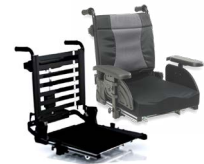
Rücken: ATA 2171