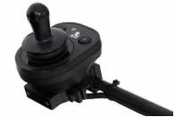
2231 / 2232