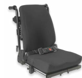
Rücken: ATA 2174, 2175